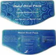
Hot Pack 6