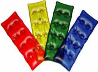
Hot Pack 1