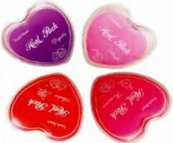
Hot Pack 5