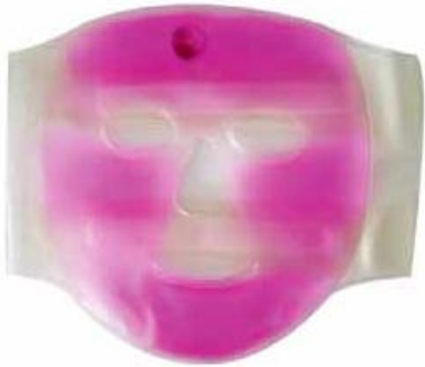
Hot Pack Gesicht