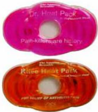
Hot Pack 8