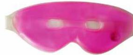
Hot Pack Augen 2