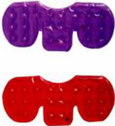
Hot Pack 2