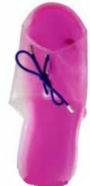
Hot Pack Fuß

Heiß-Therapie Produkte für verschiedene Körperpartien: können mit einem einfachen Klick erwärmt werden.