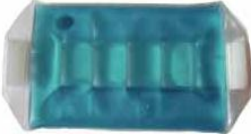
Hot Pack 4