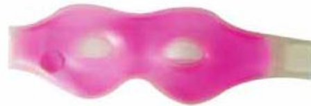
Hot Pack Augen